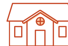
Fredet bygning udenfor kirkegård

Menighedsrådet kan selv tage stilling til en række ting, se bagsiden.