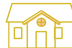
Ikke fredet bygning udenfor kirkegård

Find vejledningen på Folkekirkens Intranet under fanen Vejledninger og i feltet Folkekirkens Bygning og Arealer.